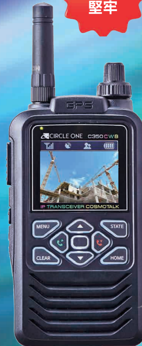
カラーハンディ・コスモトーク C350-CWB